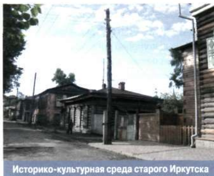
Историко-культурная среда старого Иркутска

ИСТОРИКО-КУЛЬТУРНАЯ СРЕДА , территориально-локализованное предметно-пространственное окружение человека, сочетающее в себе объекты куль-