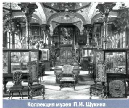
Коллекция музея П.И. Щукина

КОЛЛЕКЦИОНИРОВАНИЕ , процесс целенаправленного собирания различных артефактов и природных объектов. В отличие от собирательства характеризуется четко