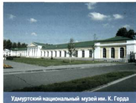
Удмуртский национальный музей им. К. Герда

БЮДЖЕТНОЕ УЧРЕЖДЕНИЕ , организационно-правовая форма учреждения культуры , деятельность которого полностью или частично финансируется собственником из соответствующего бюджета (федерального, субъекта РФ, местного или бюджета государственного внебюджетного фонда) на основе сметы доходов и расходов. Учредителем Б.у. является орган государственного/муниципального управления, который осуществляет бюджетное финансирование, предполагающее жесткую систему управления и планирования, и являющееся платой государства за социальный и экономический эффект, который проявляется за пределами сферы культуры (удовлетворение культурных потребностей граждан, вклад в развитие производительных сил). Назначенный учредителем руководитель учреждения является решающим звеном в процессе его управления. Б.у. распоряжается закрепленным за ним