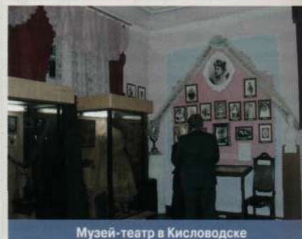
Музей-театр в Кисловодске

ПАРАМУЗЕИ , в зарубежной музеологии — учреждения музейного типа , хранящие и экспонирующие не подлинные музейные предметы , но воспроизведения музейных предметов (объектов) или объекты, специально созданные для иллюстрирования исторических событий и явлений: восковые фигуры, высококачественные репродукции произведений искусства, предметные комплексы, новоделы и т.п.