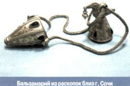
Бальзамарий из раскопок близ г. Сочи

эстетические идеалы, нормы поведения, языки и диалекты, традиции, исторические топонимы, фольклор, художественные промыслы и ремесла, произведения искусства, уникальные историко-культурные и природные территории , сооружения, технологии, результаты и методы научных исследований культурной деятельности, имеющие историко-культурную значимость и др. Государство обязано обеспечить неотъемлемое право доступа к ним каждого гражданина РФ. Понятие К.ц. определено в Основах законодательства РФ о культуре, законе РФ «О вывозе и ввозе культурных ценностей» (1993).