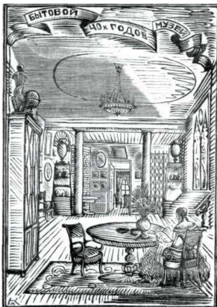
Музей дворянского быта 40-х гг. Путеводитель

МУЗЕОГРАФИЯ (от гр. museion – музей, и graphe – пишу), корпус изданий о музее, характеризующий все или одно из направлений деятельности музея или му-