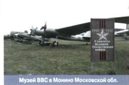
Музей ВВС в Монино Московской обл.

КЛАССИФИКАЦИЯ МУЗЕЕВ , изучение и группировка музеев по определенным организационным, правовым и содержательным признакам. Принципы К.м. определя-