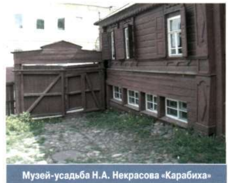
Музей-усадьба Н.А. Некрасова «Карабиха»

МУЗЕИ-УСАДЬБЫ , группа ансамблевых музеев или средовых музеев, созданных на основе музеефикации архитектурного, ландшафтного и хозяйственного комплекса усадьбы. В кон. XX в. обозначилась тенденция к музеефикации усадьбы в ее целостности, что предполагает восстановление парка, надворных построек, малых архитектурных форм и т.п., возрождение различных видов хозяйственной деятельности (конный двор, пасеки, сады и огороды, покосы и т.п.), ревитализацию окружающего ландшафта, исторически связанного с усадьбой. Это позволяет относить многие современные М.-у. к средовым музеям и присваивать наиболее