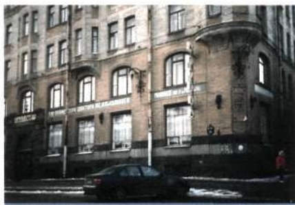
Аптека-музей № 13. Санкт-Петербург

УЧРЕЖДЕНИЯ МУЗЕЙНОГО ТИПА, учреждения, исполняющие отдельные функции музея и практикующие некоторые свойственные музеям формы деятельности. У.м.т. могут формироваться путем соединения двух (иногда и более) учреждений в одном; приобретения учреждением отдельных черт музея, не свойственных ему изначально; расширения музеем сферы нетрадиционных форм работы. К кон. XX в. сформировались различные виды У.м.т.: детские музеи , музей-театр, музей-аптека, музей-ресторан, музей-клуб, библиотека-музей, школа-музей, экономузей и др. У.м.т., сохраняющие нематериальное культурное наследие , как правило, называют живыми музеями .