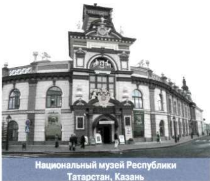
Национальный музей Республики Татарстан, Казань

ются поставленными целями — научными, административно-управленческими, юридическими и пр. В отечественном музееведении ( музеологии ) музеи подразделяются по: 1) профильным группам (см. Профиль музея ); 2) организационным типам (научно-исследовательские, научно-просветительские, учебные); 3) доминантному типу хранимого музеем наследия ( коллекционные музеи, ансамблевые музеи, средовые музеи ); 4) категориям культурной значимости (музеи федерального, регионального и местного значения; музеи — особо ценные объекты культурного наследия; музеи, входящие в Список объектов Всемирного наследия ЮНЕСКО ); 5) видам собственности — государственные музеи (федеральные, субъекта РФ), муниципальные музеи, общественные музеи, частные музеи ; 6) по правовому статусу (головные музеи, филиалы). В музееведении также используется традиционно устоявшаяся К.м. по принадлежности (государственные, муниципальные, общественные, частные, ведомственные музеи, церковные музеи ), и выделены группы музеев, обладающих специфическими признаками ( мемориальные музеи, краеведческие музеи ). Также в музейном мире функционируют учреждения музейного типа, виртуальные музеи , решающие конкретные задачи и исполняющие лишь отдельные функции музея. Рамки групп музеев достаточно подвижны; они могут изменяться в соответствии с развитием музееведения, музейной сети, форм и целей музейной деятельности.