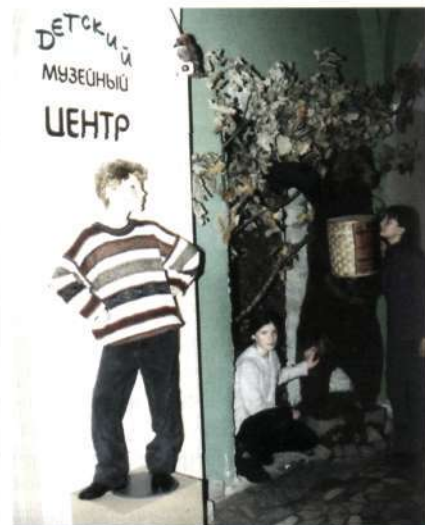
Детский музейный центр Владими́ро-Суздальского музея-заповедника

ДЕТСКИЙ МУЗЕЙНЫЙ ЦЕНТР, часть музея, где сконцентрирована работа с детской и семейной аудиторией; включает