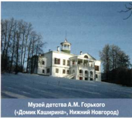
Музей детства А.М. Горького («Домик Каширина», Нижний Новгород)

ность, принципы его функционирования. Не являясь юридическим документом, программное заявление служит (наряду с Уставом музея) основополагающим компонентом разработки средне- и долгосрочной музейной политики и планирования. Уточняется и пересматривается с определенной периодичностью.