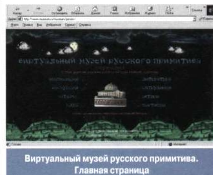
Виртуальный музей русского примитива. Главная страница

« ВИРТУАЛЬНЫЙ МУЗЕЙ », 1) созданная с помощью компьютерных технологий модель придуманного музея, существующего исключительно в виртуальном пространстве. Воспроизводит некоторые составляющие реального музея: каталоги «коллекций», «экспозицию» и т.п. Как правило, отличается возможностью обратной связи с посетителями сайта, широко представленными воспроизведениями «музейных предметов», наличием трехмерных «виртуальных экспозиций», дающих возможность виртуального путешествия по «экспозиции» и даже ее самостоятельного моделирования. 2) Электронные публикации объединенных по тематическому, региональному, проблемному