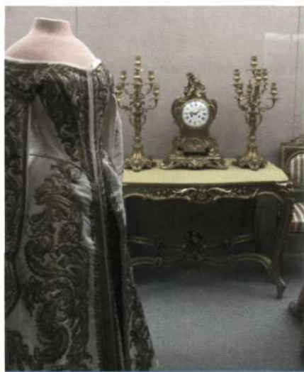
Выставка костюма. Музей-заповедник «Павловск»

сов различных целевых аудиторий музея, расширения коммуникативных возможностей музея. В. повышают эффективность использования коллекций музея, делают доступными для публики коллекции других музейных и частных собраний (см. Собрание музейное ), позволяют выносить на обсуждение актуальные, в т.ч. социальные, проблемы, представлять новые исследования в профильных науках. В. различаются по месту проведения (внутримузейные, внемузейные, межмузейные, передвижные), по содержательным признакам (тематические, проблемные, фондовые, отчетные, персональные, юбилейные и др.). Разновидностью являются постоянно действующие В., дополняющие либо замещающие основную экспозицию музея. В. могут становиться творческой лабораторией музея.