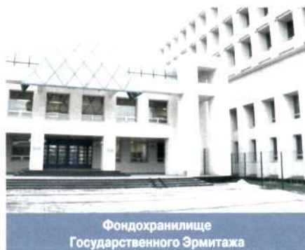
Фондохранилище Государственного Эрмитажа

ФОНДОХРАНИЛИЩЕ, помещение в музее или отдельное здание, оборудованное для хранения фондов музея . Предметы в Ф. размещаются в соответствии с принятой системой хранения и согласно действующей