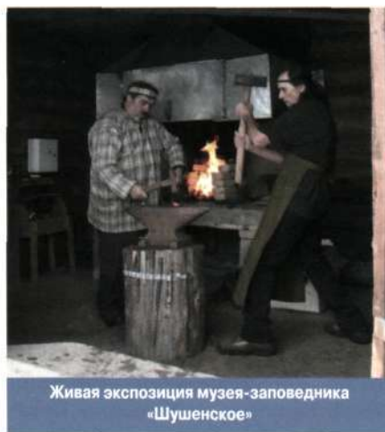
Живая экспозиция музея-заповедника «Шушенское»

ЖИВАЯ ЭКСПОЗИЦИЯ , экспозиция музейная , основу которой составляют объекты нематериального культурного наследия . Ж.э. наиболее характерны для этнографиче-