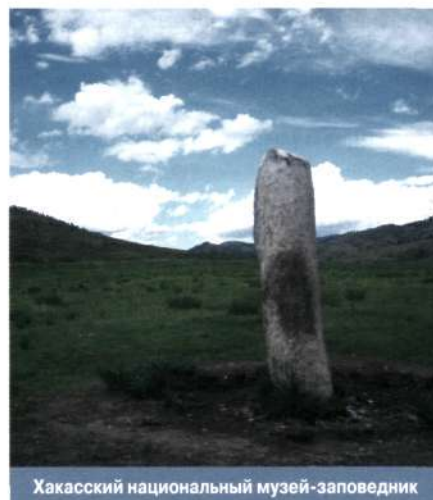
Хакасский национальный музей-заповедник

КУЛЬТУРНОЕ И ПРИРОДНОЕ НАСЛЕДИЕ , совокупность объектов культуры и природы, отражающих этапы развития общества и природы и осознаваемых обществом как ценности, подлежащие со-