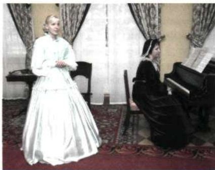
Театрализованная экскурсия в музее П.И. Чайковского в Воткинске

ПРОДУКТ МУЗЕЙНЫЙ , результат деятельности музея, представляемый в материально-вещественной, нематериальной, информационной форме; имеет творческий нестандартизированный характер. Особенностью некоторых форм П.м. является одновременность его производства