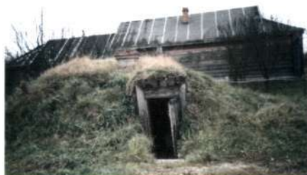
Реконструкция землянки на родине Ю.А. Гагарина в деревне Клушино, Смоленская обл.

ществлена в виде чертежа, макета, модели и других разновидностей воспроизведения музейного предмета ; в отдельных случаях создается Р. первоначального облика в