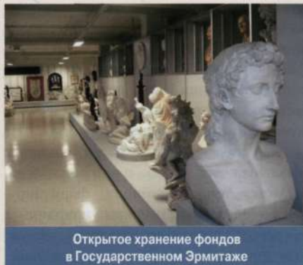
Открытое хранение фондов в Государственном Эрмитаже

ОТКРЫТОЕ ХРАНЕНИЕ , форма хранения и актуализации фондов музея , позволяющая расширить доступ посетителей к наследию. В целях обеспечения сохранности фондов музея О.х. должно осу-