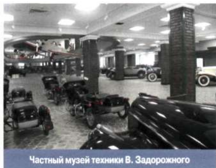
Частный музей техники В. Задорожного

ЧАСТНЫЕ МУЗЕИ , группа музеев, которые принадлежат частным лицам, созданы их усилиями и поддерживаются их средствами. Как правило, коллекции частных музеев отражают эстетические, культурные или научные интересы своих создателей