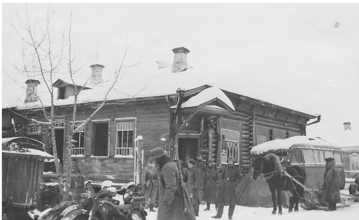
Немцы у комендатуры в оккупированном советском селе (фото носит иллюстративный характер)